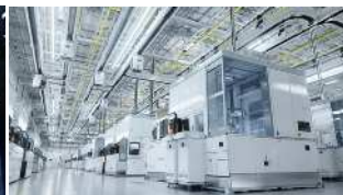
精密機器製造ライン