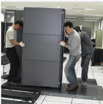
[免震テーブルの設置]

※ 国際規格Telcordia GR63 Core Zone4 規格合格 (マグニチュード 震度7.0~8.3相当)