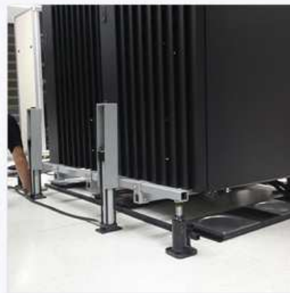
[ラックを持ち上げて設置]